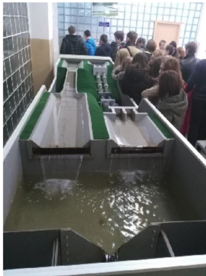
Экскурсия по кафедрам