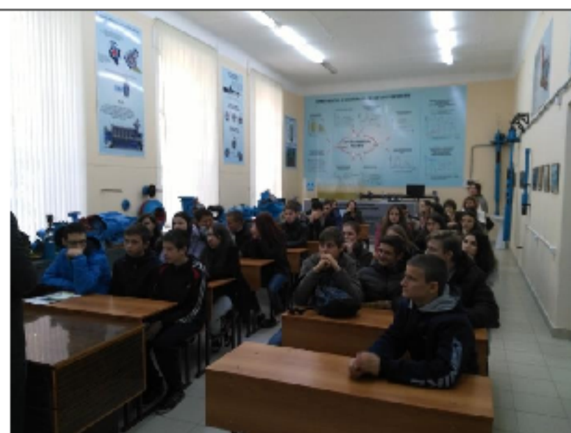
Кафедра Водоснабжения и Водоотведения