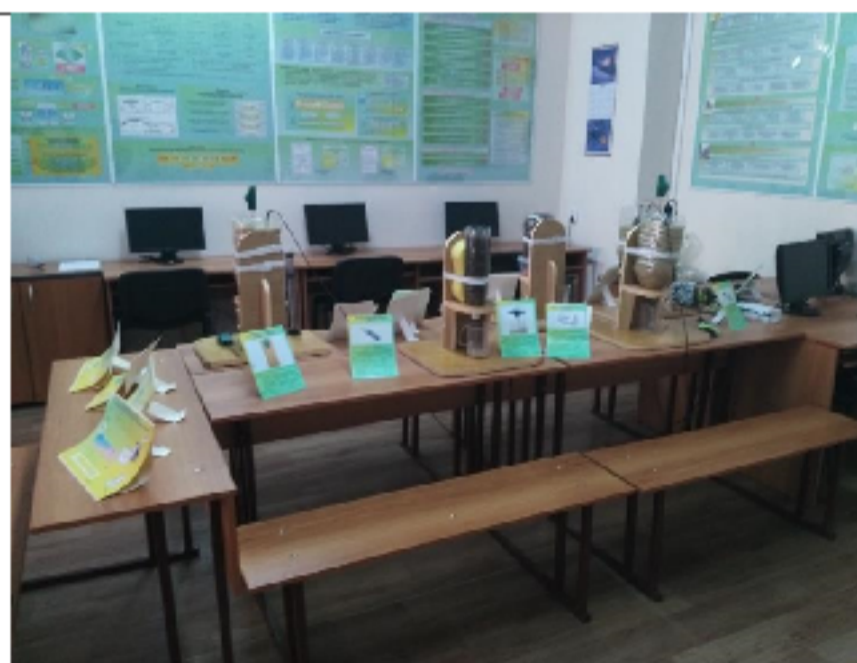
Экскурсия по кафедрам