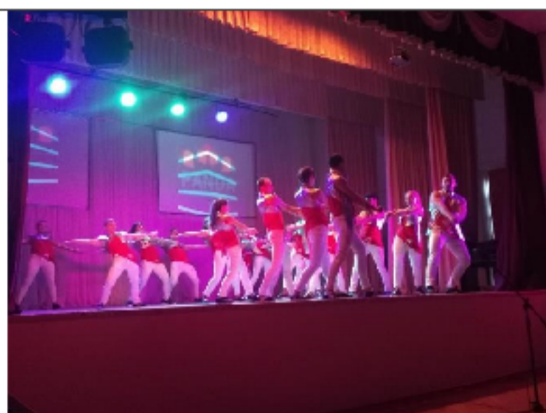
Концерт коллективов Студенческого дома культуры