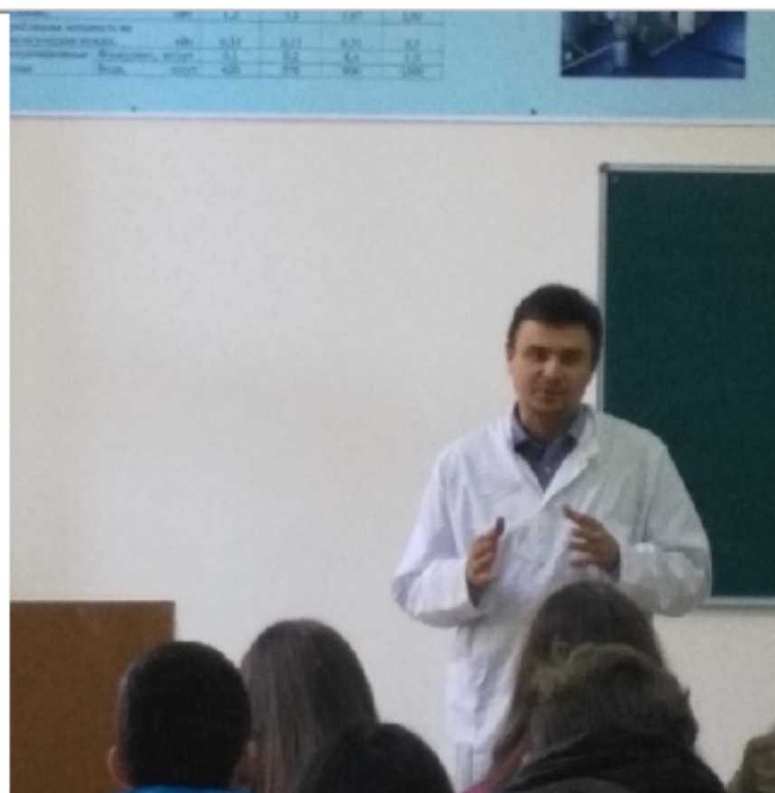
Экскурсия по кафедрам