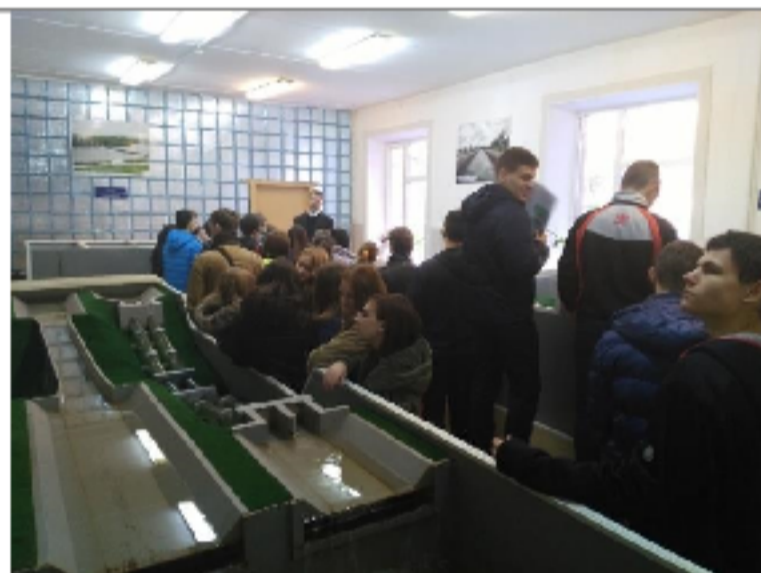
Экскурсия по кафедрам