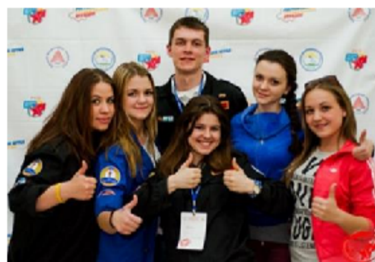
Актив штаба студенческих отрядов