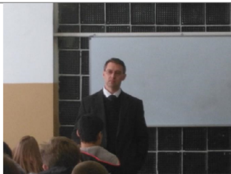
Экскурсия по кафедрам