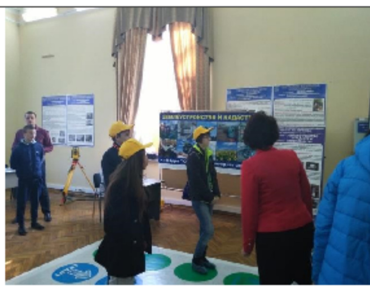
Проведение профориентационной викторины