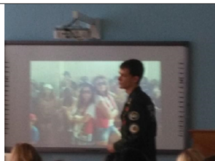
Выступление членов студенческого Парламента